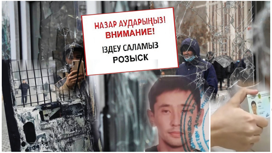
Қызыл САЛМАР (colage)

Елдегі жаппай бүлік кезінде жоғалғандардың саны нақтыланбады. Көп азамат әлі күнге дейін із-түзсіз кеткен туыс-жақынын таба алмай әлек. Жазықсыз істі болғандарды ақтап, хабарсыз кеткендерді табу үшін көмек сұрап жүргендердің қарасы қалың. Яғни, жұрт «Қаңтар трагедиясының» зардабын әлі тартып келеді. Құқық қорғау органдары тайлы-туяғымен бүлікке қатысы барлардың соңына шам алып түскен шақта хабарсыз кеткендерді іздеу қиынға соғып отыр. Дегенмен әр өңірде іздеу салып жүрген еріктілер еңбегі көңілге демеу. Сонымен, бүлік кезінде қанша адам жоғалды, қайда жүруі мүмкін?